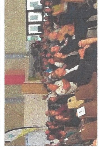
Une foule nombreuse a assisté à la remise de ces trophées.